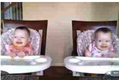
Le gemelle danzano al suono della chitarra di papà